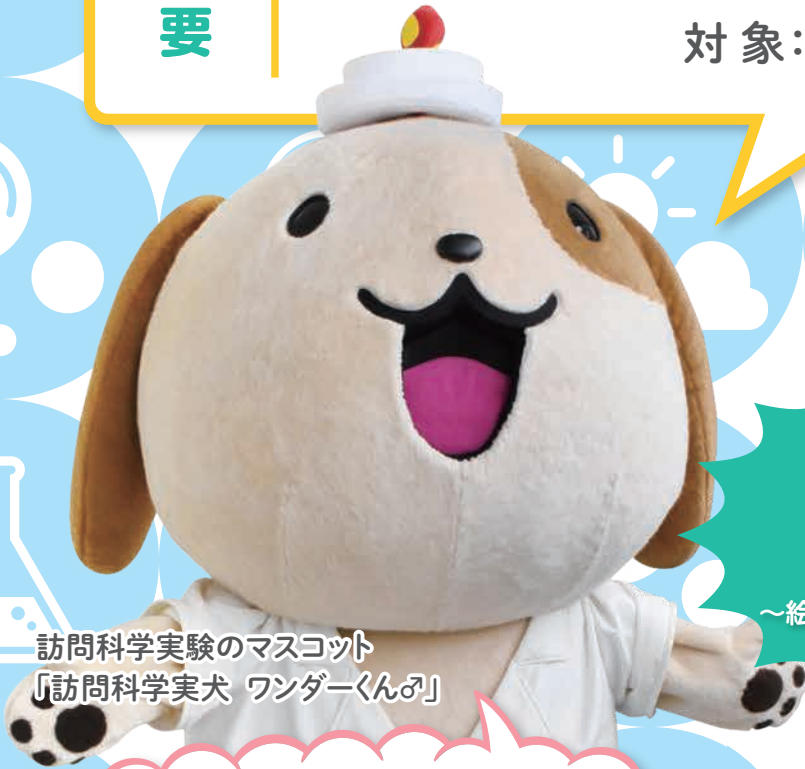
訪問科学実験のマスクット 「訪問科学実犬 ワンダーくん♩」